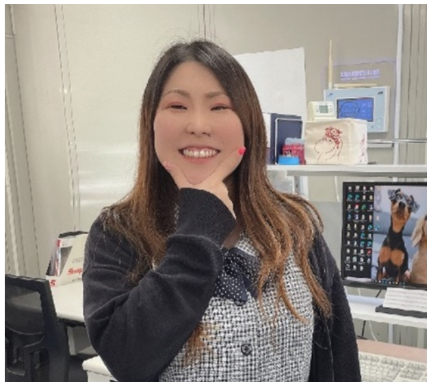
2022年5月入社 グリーンリサイクル課