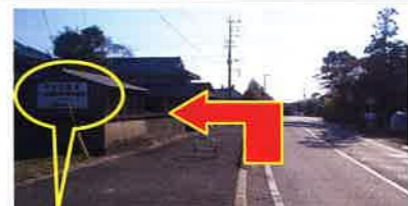
《上西郷・内殿方面から向かう場合》 小屋に看板がある民家の先を左折 ●看板の拡大図